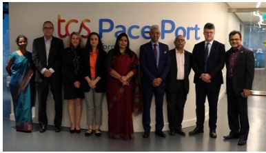
Les dirigeants de Tata au TCS Pace Port Toronto.