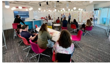
Une séance de réflexion conceptionnelle en cours.